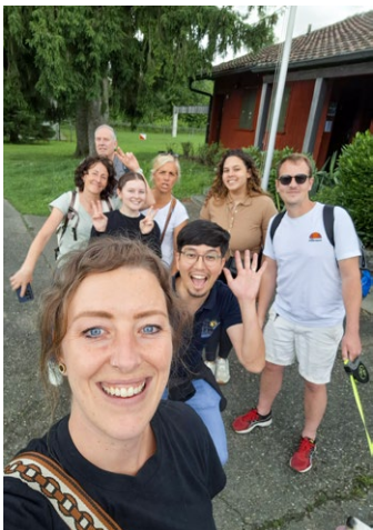
Mitarbeiterausflug und Weihnachtsfest

Anlässe wie die Chilbi stärken die Verbundenheit zur Bevölkerung und geben wertvolle Einblicke in die Bedürfnisse unserer Gemeinde.