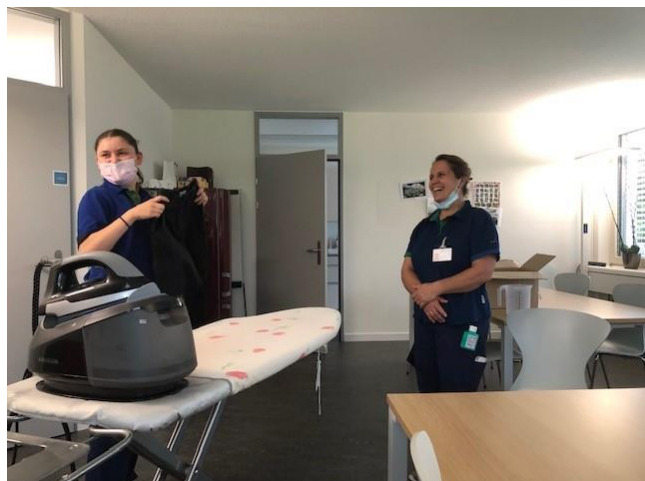
Auch Bügeln will gelernt sein – daher im Spitex-Zentrum eine Schulung

Der Zusammenhalt im Team wird oft als einmalig bezeichnet. Die verschiedenen Teams (Hauswirtschaft und Pflege) arbeiten Hand in Hand und betreiben einen regen Austausch. Die Mitarbeiteranlässe, die die Spitex Zollikon durchführt, werden sehr geschätzt. Sei es am Mitarbeiterausflug oder am Weihnachtessen – das Treffen in einem anderen Rahmen ist geprägt von unbeschwertem Zusammen sein und guter Stimmung.